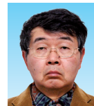
永田 尚志 (ながた ひさし)

1967年生まれ。2009年より京都大学大学院地球環境学堂教授。2012年日本学術振興会賞。専門は土木工学・地盤環境工学。建設リサイクルや廃棄物処分における地盤工学課題に関する研究に従事。